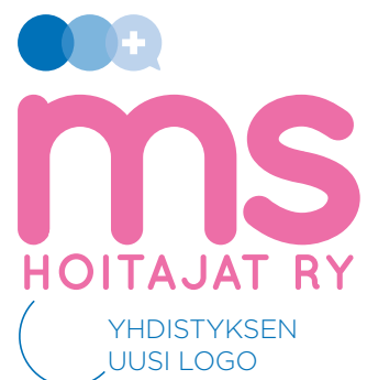
YHDISTYKSEN UUSI LOGO